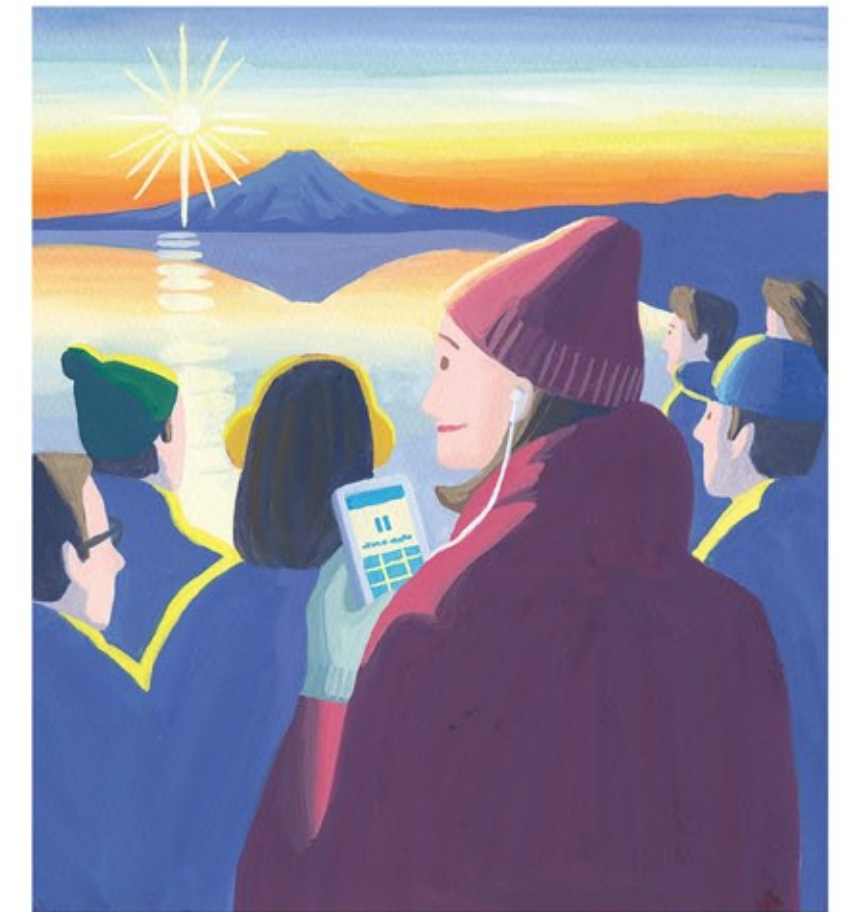
左下： 玄光社「ファッションイラストレーションファイル」 右下： 「民放2020年1月号」表紙 / アクリル絵具、画用紙、2019年