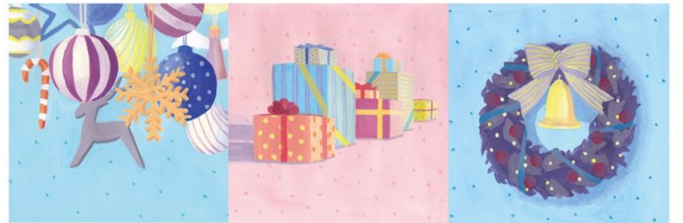
すべて： オリジナル作品 / アクリル絵具、画用紙 2019年