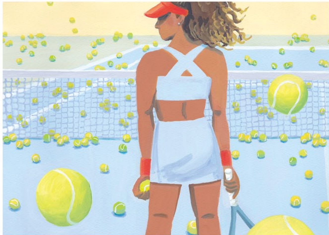
オリジナル作品「 Behind the scenes 」 / アクリル絵具、画用紙 2019年